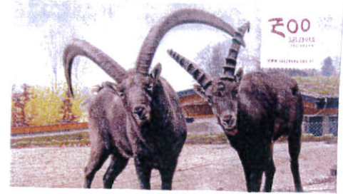
Neues aus dem Zoo Salzburg

anschließend Zusteigemöglichkeit in Grafengars, Köllersiedlung und Feuerwehrhaus Jettenbach